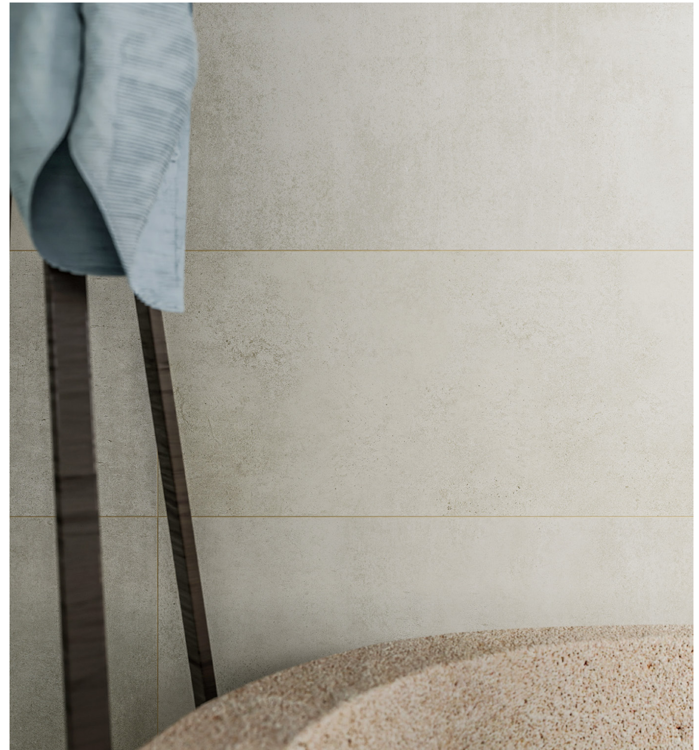
shabby chic 30x90/12"x36" /rectified/