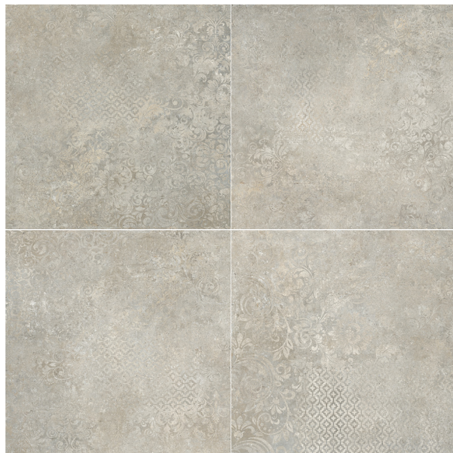
bohemy natural 60x60/24"x24" rectified 5901503226292