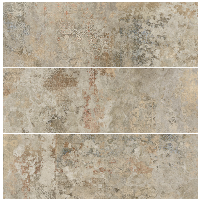
shabby chic carpet 30x90/12"x36" rectified 5903943502738