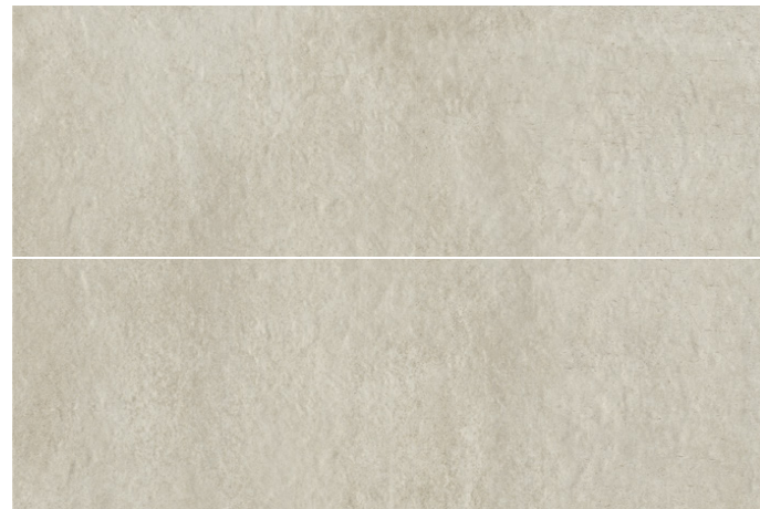
shabby chic 30x90/12"x36" rectified 5903943502714